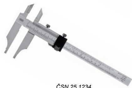
ČSN 25 1234