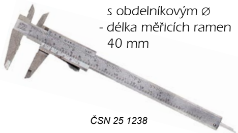
ČSN 25 1238

ČSN 25 1238 - s nožíky pro vnitřní měření a hloubkoměrem s obdelníkovým \emptyset - délka měřících ramen 40 mm