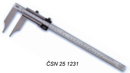
ČSN 25 1231

ČSN 25 1234 - s měřícími nožíky, se stavítkem, INOX-CHROM